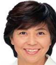
神奈川県議会議員